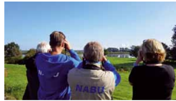
Vögel beobachten mit dem NABU

ziale Fragen und Lust auf zwei Wochen Gemeinschaftsleben. Auf dieser öko-politischen Fahrradtour von Hamburg über das Wendland nach Stralsund übernachten Sie in Gemeinschaftsunterkünften und werden von der mobilen Küche mit veganen Köstlichkeiten gepflegt. Der Teilnehmerbeitrag für Organisation, Übernachtung und Vollverpflegung beträgt, je nach Einschätzung der eigenen Mittel, zwischen 15 € und 30 € pro Tag. Es ist auch möglich, nur einzelne Etappen mitzuradeln.