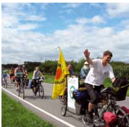
Unterwegs mit der Tour de Natur

Für jedes Alter ist die Tour de Natur geeignet, die der BUND (Bund für Umweltschutz und Natur Deutschland) zusammen mit anderen Umweltschutzgruppen vom 20. Juli bis 3. August organisiert. Voraussetzung: ein tourentaugliches Fahrrad, Engagement für ökologische und so-