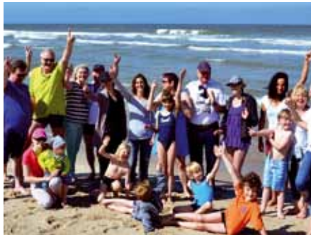
Badespass auf Sylt mit der DHG

Preisgünstige Reisen bietet auch das Jugendberufshilfswerk Hamburg an. Teilnehmen können Kinder und Jugendliche zwischen 8 und 15 Jahren. Ob an der Ostsee oder an der Nordsee, im Schwarzwald oder Allgäu: Bei den 14- bis 19-tägigen Reisen wird viel unternommen, zum Beispiel Reiten, Windsurfen, Abenteueramping oder Kanufahren. Die Reisen kosten je nach Dauer regulär zwischen 450 € und