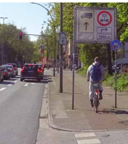
Einfädeln mit Augenmaß - mehr Platz für Fahrradfahrer ist geplant

Gut für die Fußgänger: An mehreren Abschnitten sollen durch die Neuordnung der Fahrspuren die Gehwege verbreitert werden. Und für spontane Radler wird an der Kreuzung Holstenstraße eine neue