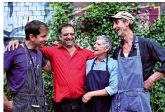
Das Cantina-Team freut sich auf Gäste

Auch diesen Termin sollten Sie schon mal vormerken: Am Samstag, den 15. Juli ab 14.00 Uhr findet im Zeiseweg und auf dem Hof der Viktoriakaserne ein großes Sommerfest für die Nachbarschaft statt. Es erwarten Sie Flohmarktstände, Musik, viele Aktivitäten für Kinder und natürlich was Leckeres zu essen. Organisiert wird das Fest von der fux-Genossenschaft,