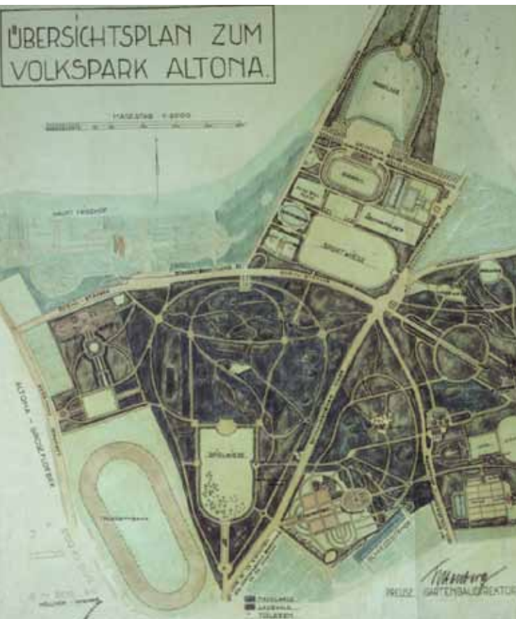
Plan von 1930, gut erkennbar die vier Parkteile

zwei Hälften, denn die August-Kirch-Straße, dieser alte Landweg zwischen Bahrenfeld und Eidelstedt, wurde schon früh für den Durchgangsverkehr gesperrt.