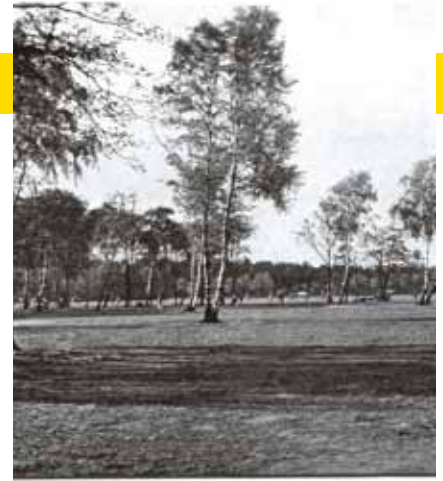
Die große Spielwiese um 1928

die Stadt Altona begann, die dafür benötigten Ländereien ohne viel Aufsehen preiswert anzukaufen. 1913 beschloss der Altonaer Magistrat den Baubeginn, im September 1914 erfolgte der erste Spatenstich. Rund 1000 durch den Kriegsbeginn arbeitslos gewordene Männer zogen mit Schaufeln und Äxten in die „Bahrenfelder Tannen“, legten Wege an, pflanzten