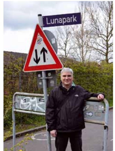
Nur ein Straßenname ist von dem großen Vergnügungspark übrig geblieben

Zeitzeugenberichte, Postkarten, und Artefakte. Besuchen Sie ihn auf seiner Webseite. Unter www.luna-park-altona.de können Sie sich selbst in die bunte Rummelplatz-Welt von vor 100 Jahren träumen und bestimmen Sie dann und wann auf Ihren Spaziergängen unseren Kiez auch mit anderen Augen sehen.