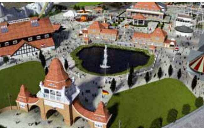
Der Lunapark um 1913 als 3-D-Modell