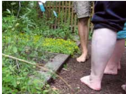
Natur hautnah im Barfußpark Egestorf

Eintritt und Kaffee & Kuchen. Die Ausflüge starten immer um 13.00 vor dem Bürgertreff in der Gefionstr. 3 und enden auch hier. Anmeldung: Tel. 42 10 26 81.