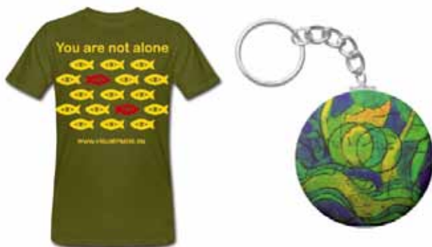
T-Shirt und Schlüsselanhänger, designet by Jupp Hartmann

Grundsätzlich schätzt es Jupp Hartmann, mit viel Zeit und Muße an kreative Prozesse heranzugehen. Diese Zeit nimmt er sich auch für die Weiterentwicklung seiner Kunst. So ist eines seiner ersten Bilder nach vielen Jahren auch immer wieder Motivgeber für aktuelle Werke oder Projekte. Wer neugierig geworden ist, sollte einfach mal im Brückenstern, Stresemannstraße 133, vorbeischaun, hier hängen eini-