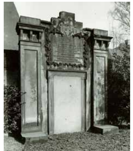
Zustand der Hügelgrabanlage Blücher kurz bevor sie 1959/60 mit einem Zuschuss des Denkmalschutzamtes erstmals restauriert werden konnte.

Vor fast 40 Jahren, im Jahr 1977, wurde der Friedhof entwidmet und bereits im Mai 1978 als Park wiedereröffnet. Der Verein Freunde der Denkmalpflege in Hamburg e.V. bezeichnet diesen Ort neben dem Lohbrügger Friedhof in einem vor zwei Jahren herausgegebenen Faltblatt über historische Hamburger Friedhöfe zu Recht als gelungenes Beispiel für die Umwidmung aufgelassener Friedhöfe in öffentliche Parks. Neugierig geworden? Wer tiefer in die ganz besondere Atmosphäre eintauchen, mehr über die Grabmale und die Geschichte des Wohlersparks erfahren möchte, kann dies mit mir gemeinsam am Donnerstag, den 24.09. bei einem ca 1½ stündigen historischen Spaziergang durch den Park. Treffpunkt: 18.00 Uhr vor dem Haupteingang an der Norderreihe / Teilnahmebeitrag 10 €.