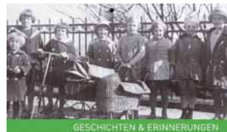
GESCHICHTEN & ERINNERUNGEN

Suchen Sie noch ein Weihnachtsgeschenk? Auch 2016 gibt es wieder einen wunderschönen Stadtteilkalender der Pauluskirche, mit vielen historischen Fotos und Erinnerungen. Den Kalender bekommen Sie für 5 € im Büro der Pauluskirche oder im Bürgertreff.